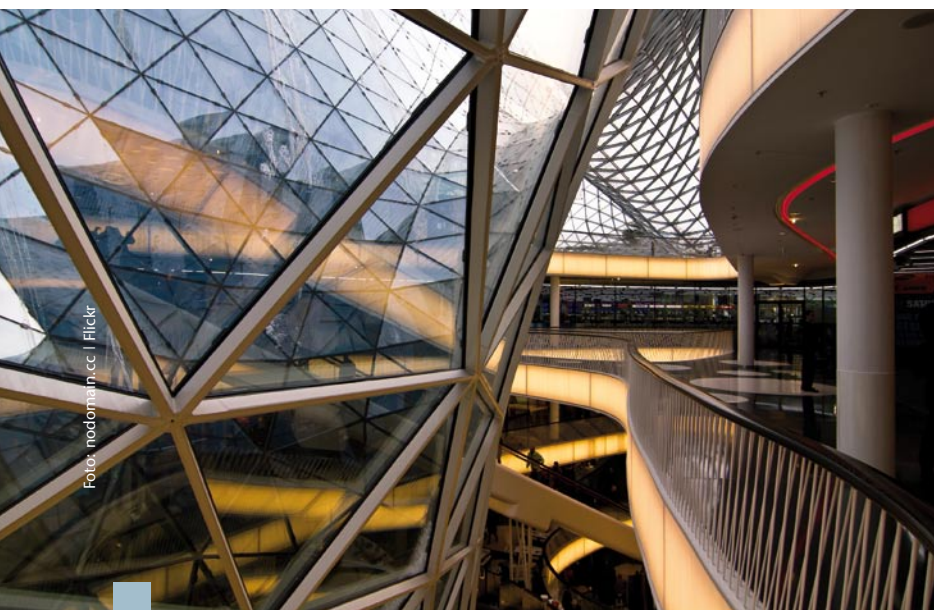
Das PalaisQuartier in Frankfurt bietet mit MyZeil ein architektonisches Highlight und eines der größten Shopping-Center in Deutschland mit Wellness-Etagen, Gastro-Boulevard und einem modernen Büroturm.

Einzelhandelsimmobilien sind bei Investoren wie Immobilienfonds oder Versicherungen derzeit stark gefragt. Das Immobilienunternehmen CB Richard Ellis bezifferte das Transaktionsvolumen in ganz Deutschland in diesem Bereich in den ersten neun Monaten 2010 auf 12,3 Mrd. Euro, bei Jones Lang Lassalle ist von 13,1 Mrd. Euro die Rede. Beide stimmen darin überein, dass Einzelhandelsimmobilien derzeit etwa 50 Prozent des Investmentmarktes bestimmen. Büros seien nur mit etwa 30 Prozent vertreten. Nicht Zweifel am Bürosektor seien dafür verantwortlich, sondern die Tatsache, dass die Investoren bereits sehr „bürolastige“ Portfolios besäßen. Shopping-Center seien deshalb sehr attraktiv, weil sie im Zuge von Mieterwechseln permanent modernisiert und an neue Ladenkonzepte angepasst würden. Da der Einzelhandel derzeit von steigenden Umsätzen ausgehe, versprechen sich auch die Centerbetreiber höhere Mieten, die oft an den Ladenumsatz gekoppelt sind.