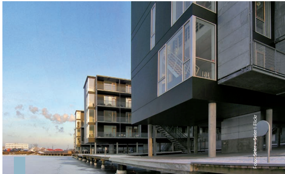
Neue Gesetze, aktuelle Entwicklungen – auch im Jahr 2011 gibt es für Immobilien-eigentümer, Mieter und Immobilieninteressenten viel zu beachten.

Die Finanzkrise hat dazu geführt, dass sich der Gesetzgeber besonders mit den Bereichen Bankwirtschaft und Kapitalanlage auseinandergesetzt hat. Für das erste Quartal 2011 wird das neue Anlegerschutzverbesserungsgesetz erwartet, das den Schutz vor falscher Beratung vor allem bei geschlossenen Fonds verbessern soll. Auch kleinere Änderungen des Erbrechts stehen an: Vor dem 01.07.1949 geborene nichteheliche Kinder sollen den ehelichen Kindern gleichgestellt werden und ein Erbrecht erhalten. Bereits in Kraft getreten ist das Gesetz zur Umsetzung steuerlicher EU-Vorgaben, durch das der „Wohn-Riester“ auch für die Finanzierung des Wohnsitzes im EU-Ausland verwendet werden kann. Energiepolitisch ist die Bundesregierung von der Einführung eines Modernisierungszwanges für Bestandsgebäude abgerückt – langfristig sollen finanzielle Anreize für eine Umsetzung sorgen. Die Märkte senden für 2011 positive Signale: Die niedrigen Hypothekenzinsen schaffen ein günstiges Investitionsklima und die Immobilie stellt weiterhin eine sichere, rentable Wertanlage dar.